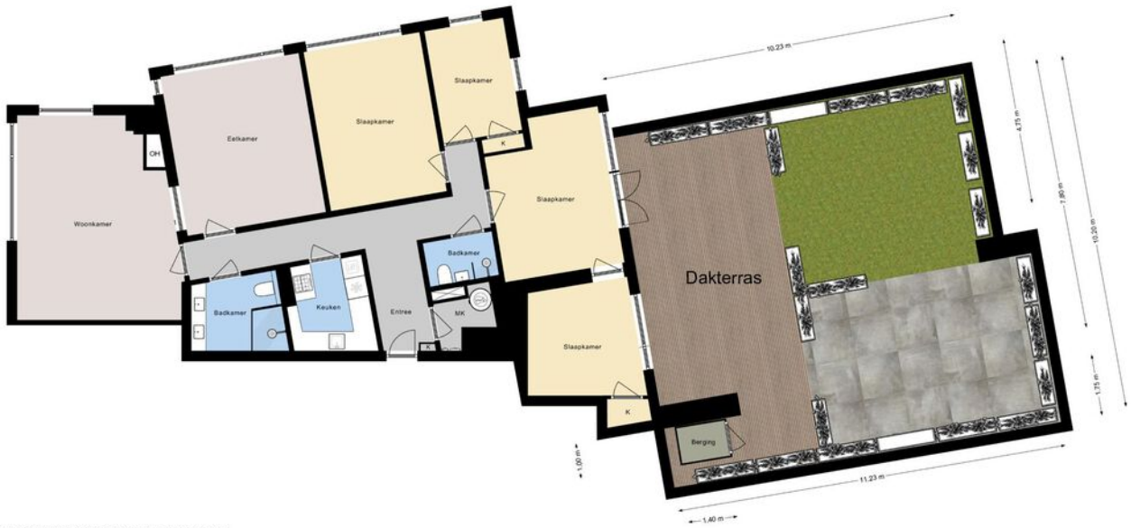
JOZEF ISRAELSPLEIN 33 | 3e Verdieping | Hoogte 2.88m |